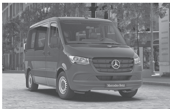
Nachfolgermodell Mercedes Sprinter