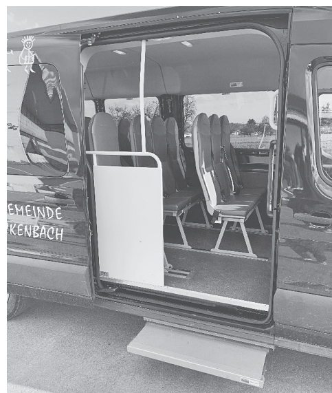
Seitenschutz / Trittbrett Einstieg

Die Anschaffung erfolgt über die Garage Hilber in Märwil in Zusammenarbeit mit der Firma Larag AG in Wil.